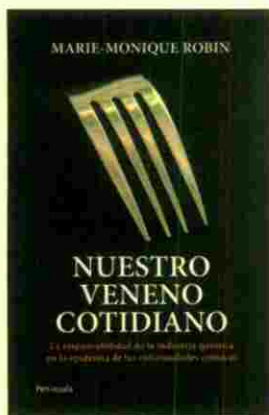
NUESTRO VENENO COTIDIANO Marie-Monique Robin Península. Barcelona, 2012. 672 págs. 24 €.

El mundo según Monsanto (2008), en el que atacaba sin piedad a la multinacional agroquímica, adquirió fama mundial. Ahora vuelve con Nuestro veneno cotidiano , en el que atribuye muchas de las enfermedades actuales a la sopa química que encontramos en nuestros mercados y restaurantes. En los últimos 30 años, defiende Robin, el índice de cáncer ha aumentado más de un 40 por ciento. En este mismo período, el incremento de enfermedades como la leucemia y