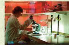
監督:マリー＝モニク・ロバン カナダ国立映画制作所・アルテ フランス共同製作 (2008年/フランス、カナ ダ、ドイツ/108分/原題:Le monde selon Monsanto) 監録:宣伝:アアプリンク 9月1日より、渋谷アアプリンク ほか全国順次公開